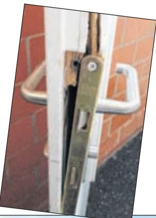
Aufgebrochene Türe im Sahligut-Schulhaus in Biel.

Agglo. Die unheimlichen Einbrüche gingen diesen Herbst weiter: Betroffene waren erneut das Sahligut sowie das OSZ Mardretsch. Mittlerweile scheint die Serie die Agglomeration erreicht zu haben. Kürzlich wurde auch in Pichards Schule in Orpund eingebrochen, «das erste Mal seit mehreren Jahren». ■