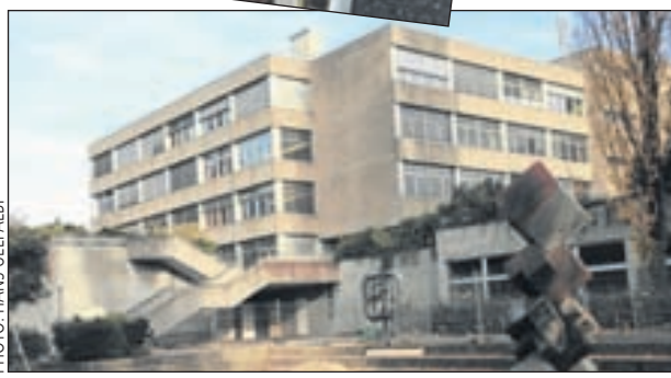
Cible des cambrioleurs: le collège du Sahligut.