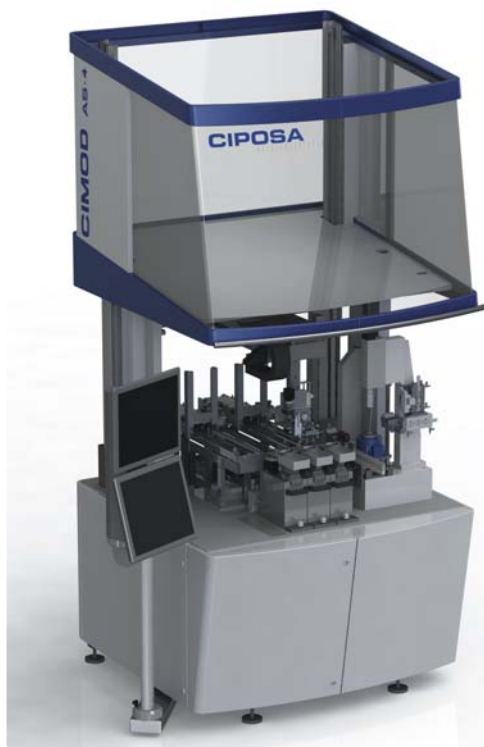
La machine CIMOD AS 4 comportant trois stations.

Ciposa SA 2068 Hauterive Tél.: 032 566 66 00 www.ciposa.com ●